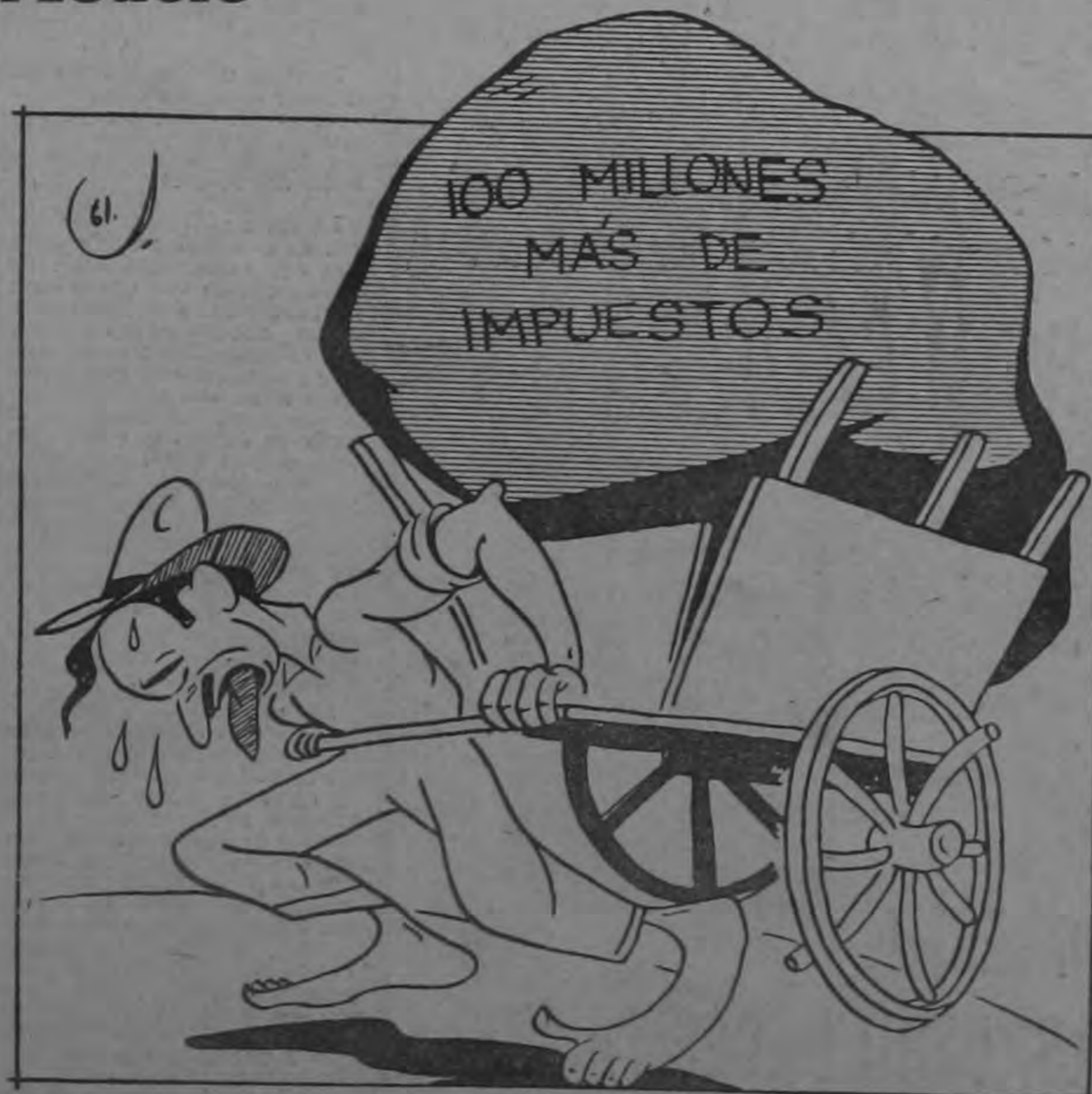
para bordar un almohadón.

"No es cierto que el Instituto Nacional de Seguros esté de acuerdo con el proyecto de traspaso del Seguro de Riesgos Profesionales, presentado a la Asamblea Legislativa, pues todavía no se ha pronunciado oficialmente sobre el citado proyecto"